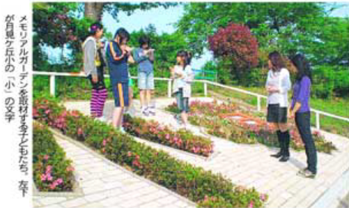
メモリアルガーデンを造る中、花壇が月見ヶ丘小の「小」の文字