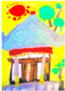
おまんの作られたお寺 2年・阿部健生太