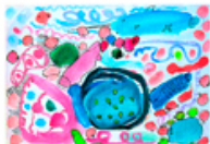
世界の海のふしぎ 5年・内海綾