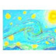
コッホの心とふれて 5年・菅野 花