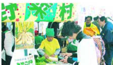
祭りに出た「野菜村」の出店