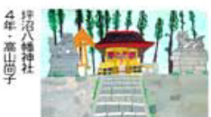
坪沼八幡社 4年・津山 伸子