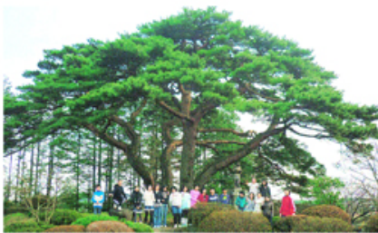
校木を開いて、みんな元気