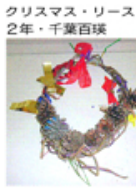
クリスマス・リース 2年・千葉百珠