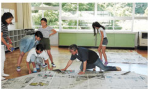
地域の小学校のおまつりで、巨大新聞紙ドームを作る