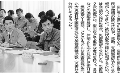
宮城県災害対策本部会議で、災害情報を受託した村井和雄知事(中央)が、対応を協議する。2011年3月22日午前10時25分ごろ、宮城県庁