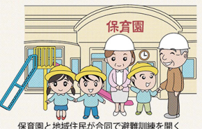
保育園と地域住民が合同で避難訓練を開くなどして交流を深める