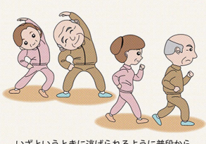
いざというときに逃げられるように普段から体力づくりに取り組む