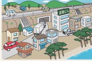
津波避難施設だけでなく複数の避難方法を確保する