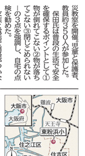
東日本大震災の教訓を多岐の備えに活かすため、河北新報は10月1日、巡回ワークショップ「むすび塾」を大阪府住吉区の東粉浜小(か)に実施した。東交以外の開催も予定48回で、毎日放送、大阪府との共催、東北大学国際研究所、電通と共同開催する避難避難準備事業「カンパケリ日本」と連動し、学校と地域住民による避難訓練も実施した。話し合いでは、参加者らが成果や課題について意見を交わした。