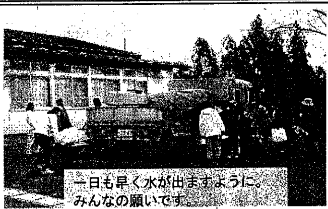
「一日も早く水が出ますように。みんなの願いです。」