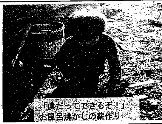
「ほだってできるぞ!」お風呂沸かしの薪作り