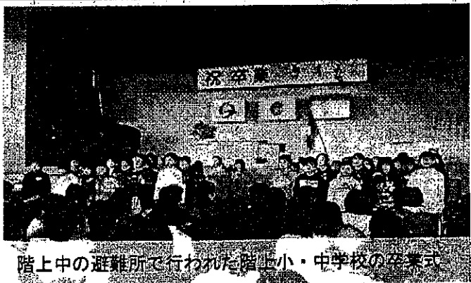
階上中の避難所で行われた階上小・中学校の卒業式