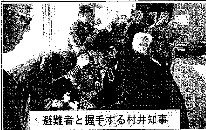
避難者と握手する村井知事