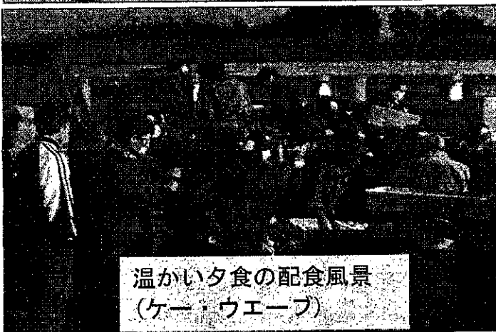
温かい夕食の配食風景 (ケーキ・ウエーブ)