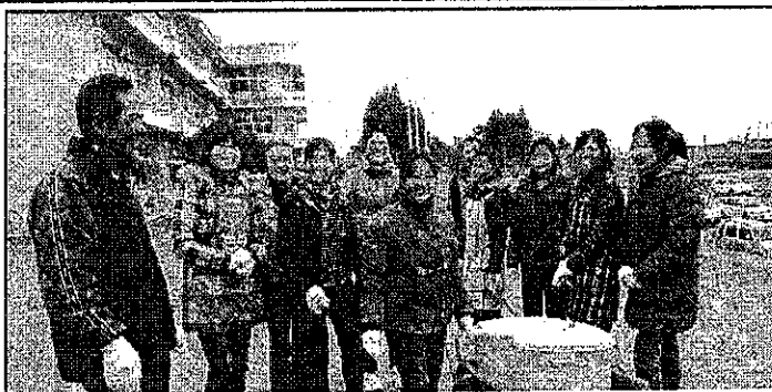
面瀬地区での避難生活にもようやく慣れて自分たちでも食事の準備をする中国人避難民。(水の運搬中)