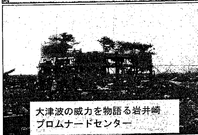
大津波の威力を物語る岩井崎 プロムナードセンター