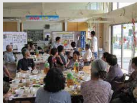
【昨年の七夕交流会の様子】