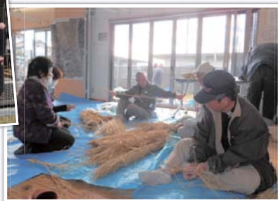
(上) 12月17日役員会の様子 (下) 合戦原行事のしめ縄作りと集合写真

合戦原学堂で12月21日、総勢50名の参加のもと、女性は餅料理作り、男性は赤飯や餅米の炊飯と餅つきをしました。それぞれの持ち場や合戦原福寿会が指導を行いながらのしめ縄づくりでは、和気あいあいに笑い声が聞かれました。作業後はおいしい雑煮餅やあんこ餅、納豆餅、きなこ餅を楽しくいただきました。