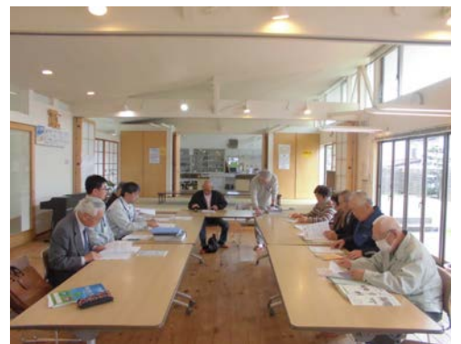
町担当を交え新年度最初の役員会

業務委託については、4月中に契約し5月から始動できるように進めている。まち協支援は、業務委託の中で各地区に推進員1名を置き、協議会案内、まちづくりニュースの発送支援、町との調整などを案としてあげていると説明を受けました。