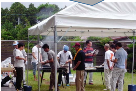
▲町応援職員の協力ですべきー、そばめしを作りました!