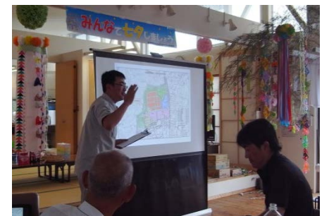
▲町担当より進捗状況の説明

協議会主催の「第3回七夕交流会」を開催しました。当日は、宮城病院職員、協議会役員、町の応援職員で協力しスムーズに進行できました。