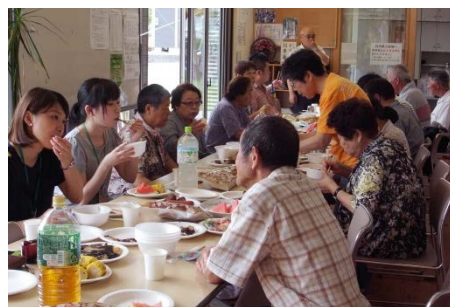
▲お楽しみの昼食タイム、そばめしが大好評!