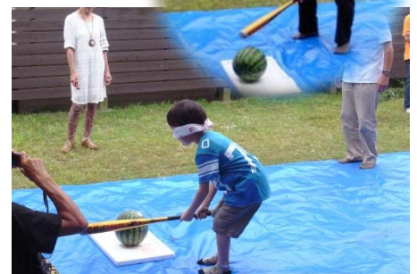
▲一番盛り上がったスイカ割り飛び入り参加もあり!