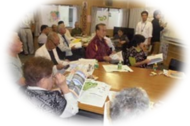
▶災害公営住宅について説明を受けました