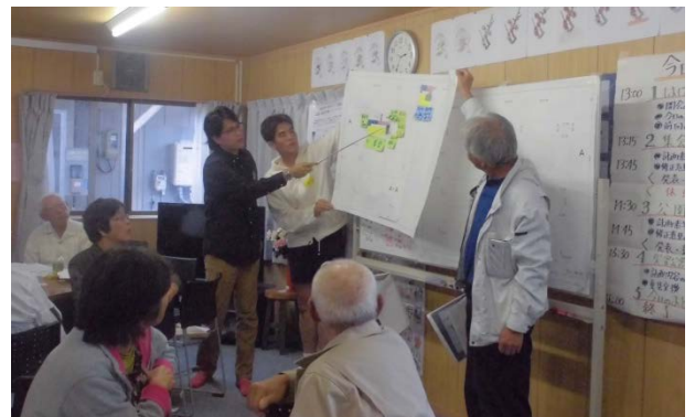
▲グループで検討した内容を発表しました