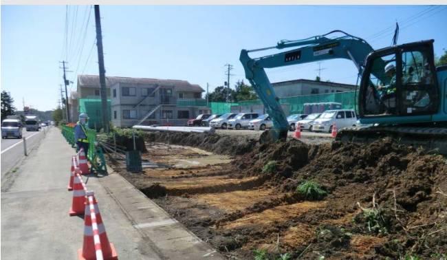
新市街地整備に伴う国道6号拡幅工事が始まりました