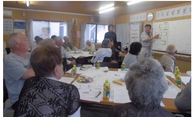
▲宅地・分譲地変更計画案の説明を聞く参加者