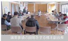
議案事項の説明をする構本副会長