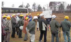
▲担当課から説明を受ける参加者