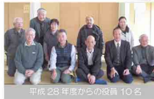
平成28年度からの役員10名