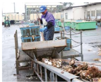
粉碎されたカキ殻は道路の舗装にも使われます

まずは島の名物であるカキの処理場を案内。「今年は雨が多く、陸から植物性プランクトンが海に流れ出て、カキの生育がとても良いんです」。クレーンで水揚げされたカキは洗浄・殺菌処理され、フォークリフトで処理場に運ばれます。「殻は粉碎機で細かくして、アサリ養殖や畑の肥料などに活用します」と説明。皆さん、殻が粉碎される様子を食い入るように見ながら「長野でもカキ殻肥料を田んぼに使っていると聞いたことがあるね」と口々に話していました。