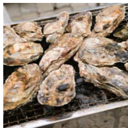
昼食はカキを堪能。味噌汁も旨みが出て美味

桂島生まれで、ずっと島に住んでいます。晴れた日は栗駒山まで見える景色のすばらしい所です。「Leboni」の協力もあり、おかげさまでたくさんの方々に越しいただく機会も増えました。私自身、さらに勉強して、どんどん島の魅力をお伝えできたらと思っています。ぜひ島の生活や歴史に触れるとともに、浦戸の食を堪能しにいらしてください。