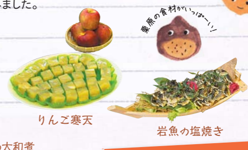
りんご寒天 岩魚の塩焼き