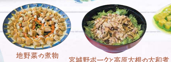
地野菜の煮物 宮城野ポークと高原大根の太和煮