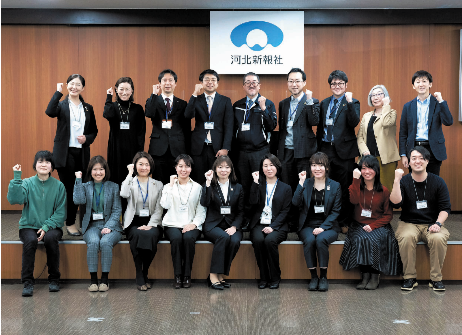
「みやぎSDGs塾」での学びと交流を経て「みやぎSDGsアンバサダー」となった参加者。今後、各企業の一員として、あるいは地域に暮らす個人として、SDGsの視点を生かした地域づくりに貢献していくことが期待されます

「みやぎSDGsファーム」は、国連が提唱する「SDGs（持続可能な開発目標）」の考え方のもとで、より豊かな地域づくりを目指す取り組み。その推進役となる「みやぎSDGsアンバサダー」を育成するプログラムが