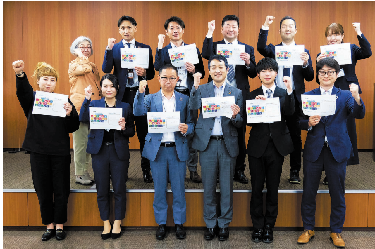
「みやぎSDGsアンバサダー」を目指す、「みやぎSDGs塾」第1ターム後期受講メンバー

そして5月26日、県内企業の担当者や個人事業主、学生ら新たなメンバーが集まり、第1ターム・後期の講座が始まりました。 SDGsの目標を自分に関連づけて SDGsは、「貧困」「ジェンダー」「健康と福祉」「教育」など17の項目について