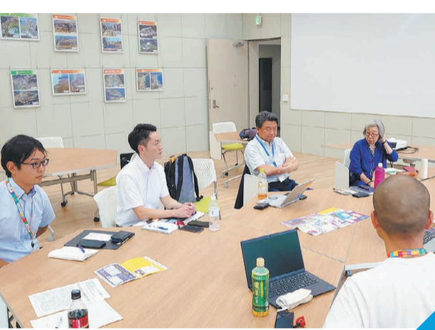
障害者アートが共生社会を知るきっかけに