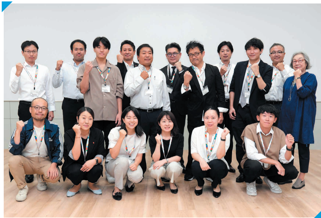
新たに「みやぎSDGsアンバサダー」となったメンバー。意気込みが表情にあらわれています

この日の「みやぎSDGs塾」は、第2ターム・後期の最後の講座(第5回)です。「標準コース」の受講者は最終課題として執筆した「わたしのSDGs活動宣言」を仲間に向けて発表。「SDGs塾」の活動で出会った人の志に刺激を受け、自身を見直すきっかけになった「SDGs」をジブンゴトとして捉えるような工夫を社内に取り入れたい」など学びの成果や今後に向けた抱負を述べ、感想や意見を語り合いました。今回の講座をもって「標準コース」を修了した16人の受講者が新たに「みやぎSDGsアンバサダー」として認定されたこと、「みやぎSDGs塾」が輩出した「アンバサダー」は合計