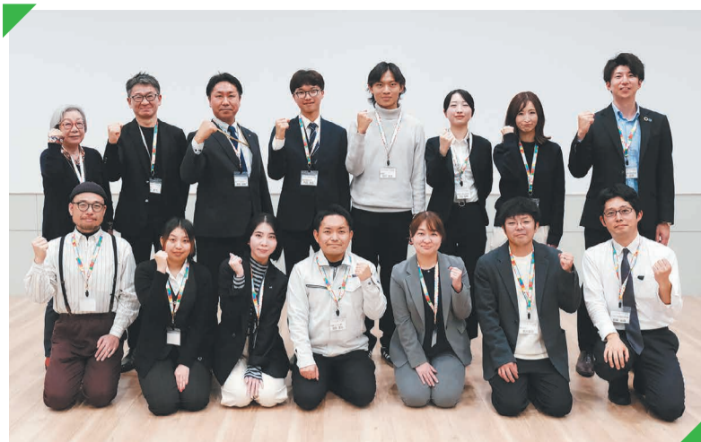
「みやぎSDGs塾・標準コース」第5ターム後期の受講メンバー

「みやぎSDGs塾・標準コース」の参加者は、3月まで5回の講座を通して学びや体験、交流を深め、修了と同時に「みやぎSDGsアンバサダー」として認定されます。「みやぎSDGsアンバサダー」には、所属する組織内での活動にと