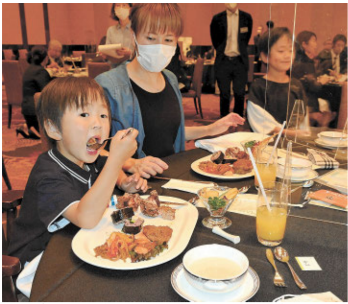
廃棄間近の食材を使ったランチを味わう家族連れ