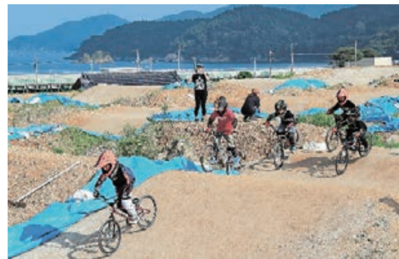
旧甫嶺(ほれい)小校庭に整備された自転車競技BMX(バイシクルモトクロス)の競技場。愛好家が技を磨きに訪れ、子どもたちも果敢に挑戦している。8月23日、大船渡市三陸町

あの日から一歩ずつ復興してきた岩手、宮城、福島3県の被災自治体を、定点撮影で毎月紹介します。