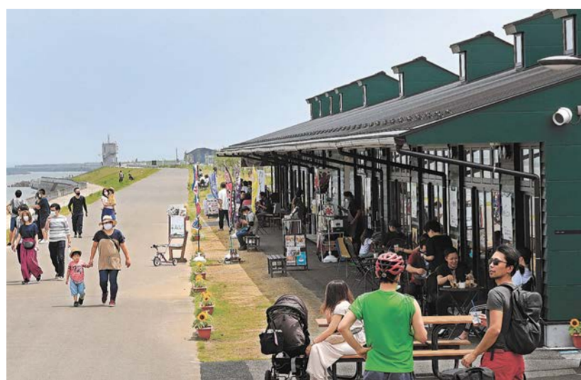
名取川沿いの商業施設「かわまちてらす閉上」には飲食店や水産加工品店など26店舗が出店している。太平洋や蔵王連峰を一望できる=1日