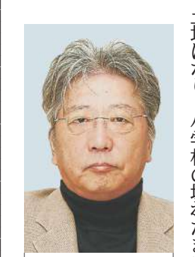
いじゅうんしつか 1950年山口県防府生まれ。立教大学卒業。仙台市で編集者、フリーライターとして活躍中。...