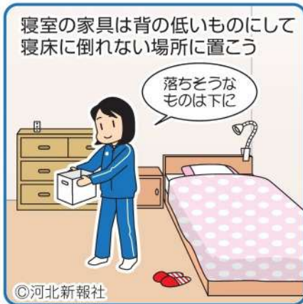
イラスト さとうあけみ