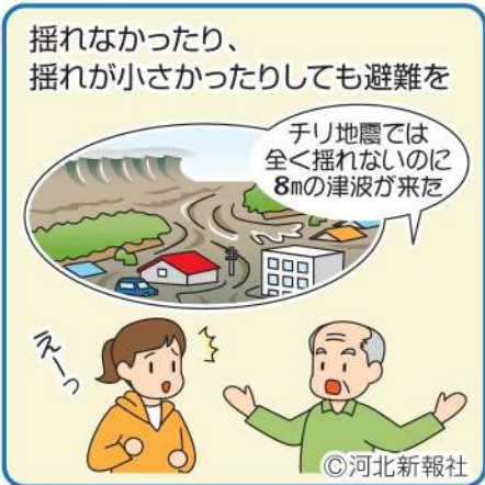
イラスト さとうあけみ