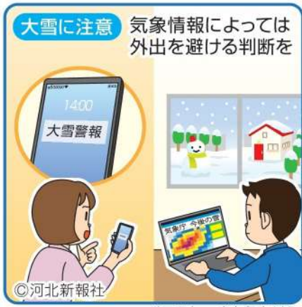
イラスト さとうあけみ