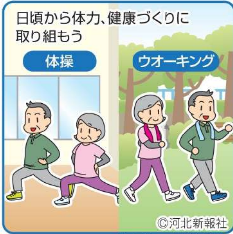
イラスト さとうあけみ