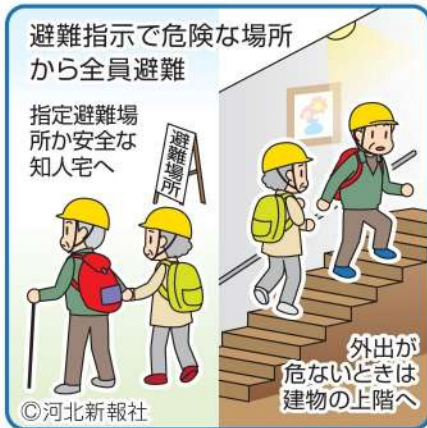
イラスト さとうあけみ