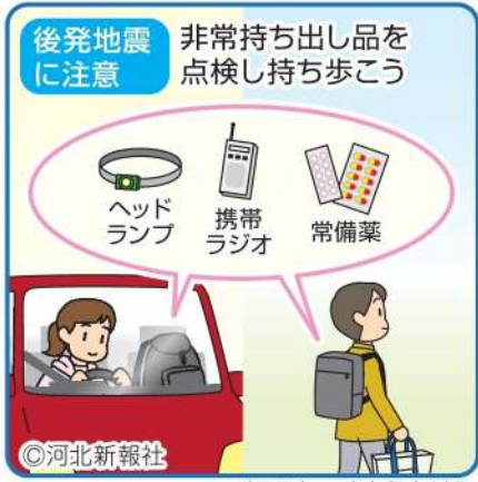
イラスト さとうあけみ