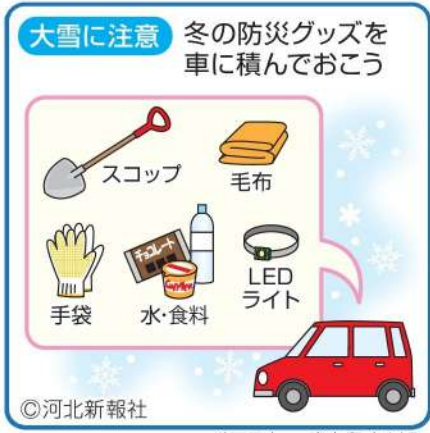
イラスト さとうあけみ