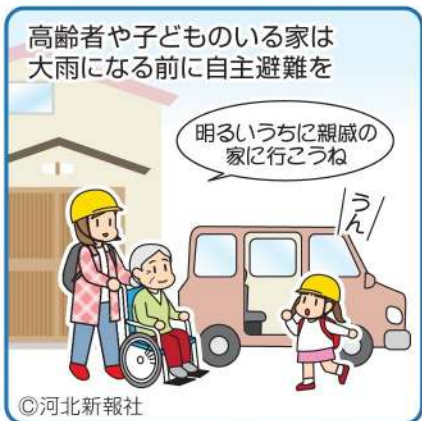
イラスト さとうあけみ