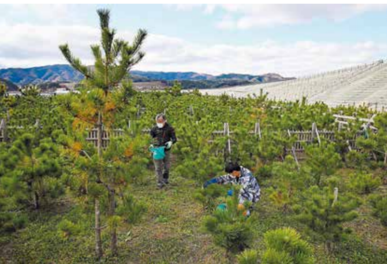
高田松原の再生を願い、地元の住民団体が一本松の遺伝子を受け継ぐ苗などを植え、手入れを続けている。7万本あった松は1本を残して流失した=11月22日