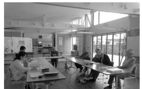
今後の役割について話し合う役員