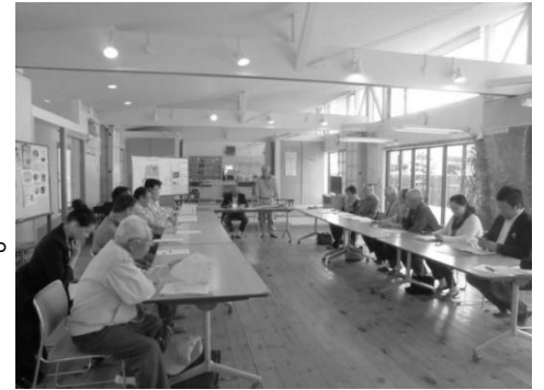
▲町担当者から説明を受けるまちづくり協議会会員

協議会へ町から情報提供がありました。町担当者は「4月23日に宮城病院周辺地区市街地整備工事について(株)フジタ・橋本店特定建設工事共同企業体と山元町の間で契約し、平成28年度(平成29年3月)まで、早期完了を目指して進めていきたいと考えている。」と話し、今後は、工事の進捗など随時情報提供していきたいとの事でした。