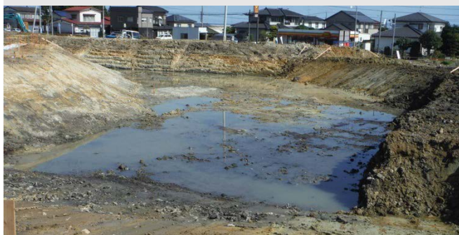
造成地の雨水を一時的に貯めておくための仮設調整池を造っています。