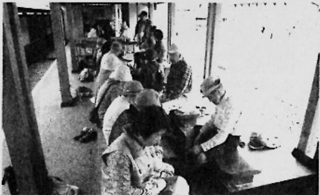
飯坂温泉の新名所・旧堀切邸の足湯

●連絡協議会では、福島市、桑折町及び周辺地域に避難する浪江町民の交流を応援してまいります。ちょっと足を延ばして遠出をしての交流など、仮設住宅などに呼び掛けていきたいと考えています。