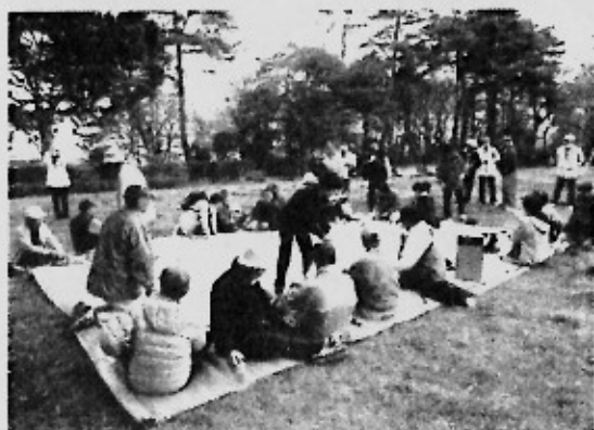
花より団子ですねっ！