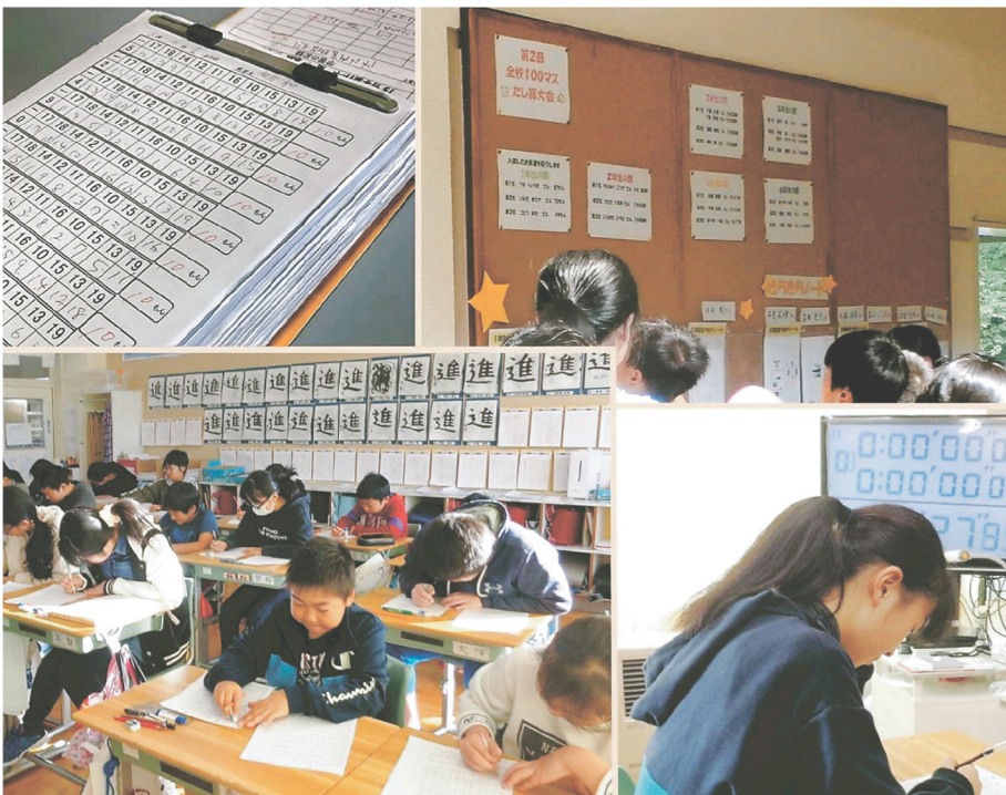
計算力・集中力アップ！ 大会実施でやる気アップ！

プリントに取り組んで2年目になります。また、放課後学習にも取り組み、ここでもプリント学習をします。プリントを習うと、1年間7ヶ月にもなります。毎日続けることで、学力だけでなく集中力も付いてきました。