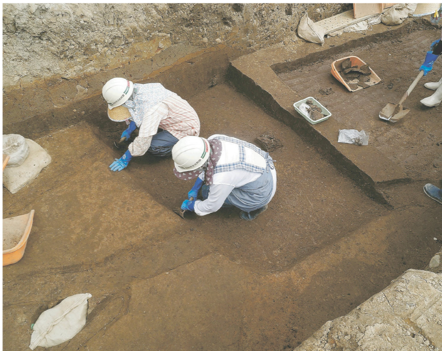
遺跡発掘中。何が出るかな？