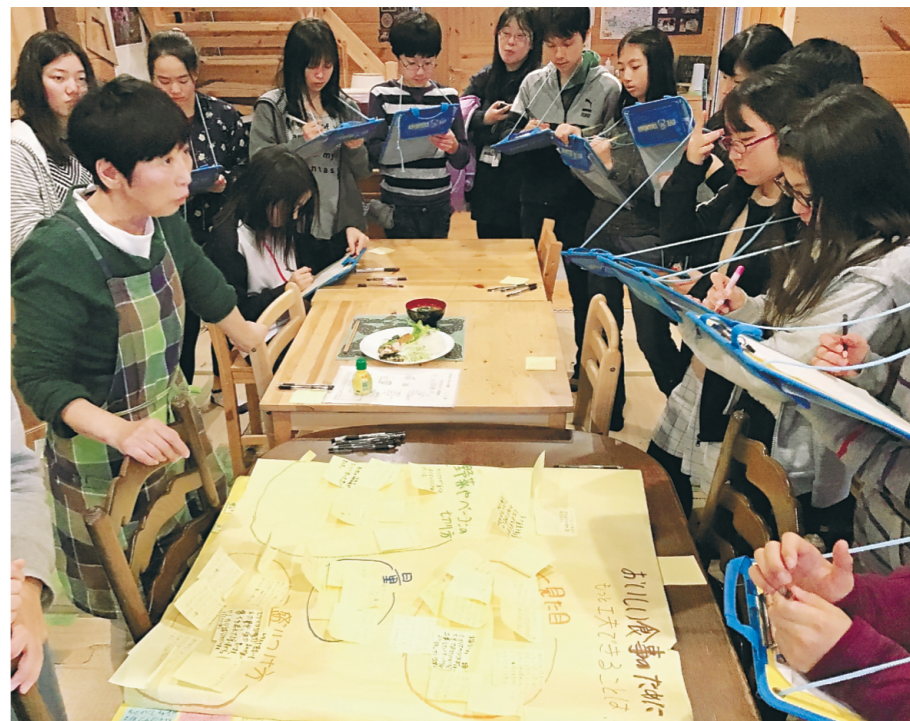
食が人をつなぐ! ざわざわキッチンとの交流

幸町小学校では、日本の伝統文化について学習しています。学校にあるお茶の木で茶摘みをしお茶作りをしたり、抹茶で地域の方をもてなしたりしています。