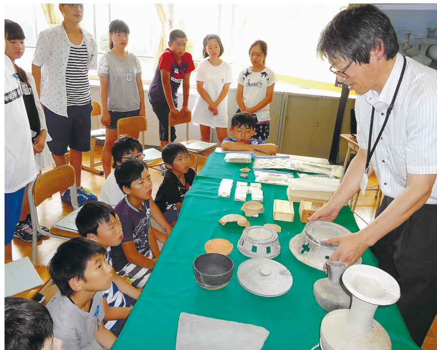
いろいろな土器を目の前にして、みんなの目が輝いていました!

東松島市には歴史ある遺跡やお墓があります。赤井小学校では、6年生が社会の学習で赤井遺跡