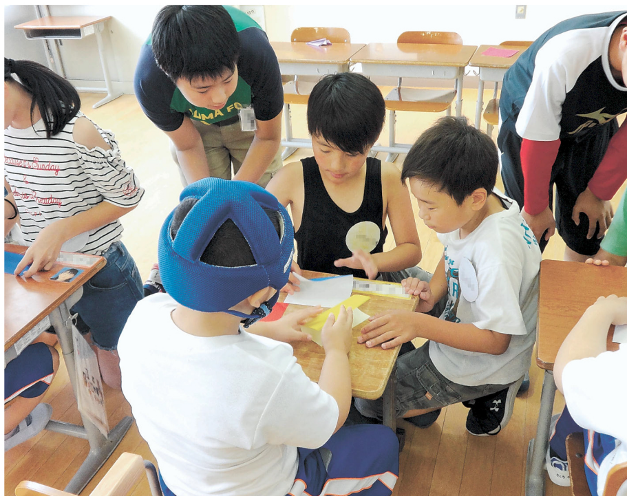
一緒に折り紙折って遊ぼうね

どで交流したりする「なかよし音楽会」をしています。2年生は「おもちゃまつり」に招待して、お店と一緒に遊びます。富谷校のみんなからは、運動会の応援の旗や6年生に卒業祝いのメッセージを掲示してもらい、思い出に残る交流ができます。