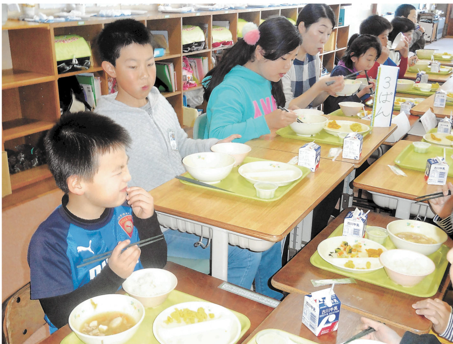
秋には全校児童が集まって給食を食べる収穫感謝の会があります

いの名前を覚えることができるのが、私たちの学校のよいところです。修学旅行の時には、1年生が「2日間雨が降らないように」と、6年生に「てるてるぼうず」を作ってくれるなど温かい交流も生まれました。これからも全校で楽しい学校にしていきたいです。