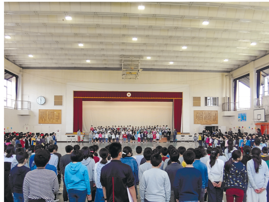
1年生を迎える会では、2年生から6年生までみんなで学校や先生の紹介をします

わたしたちの東向陽台小学校では、毎年1年生を迎える会を行っています。この行事は児童会行事で、前の年から代表委員会会で歓迎の準備をしています。 入場は1年生と6年生が手をつないで、4年生が作ったアーチをくぐります。1年生はこの学校に早く慣れてもらうために、2、3年生が学校の様子を紹介します。 今年度は2年生がはじめの言葉を担当し、歌を歌いました。3年生は校舎の紹介で、1年生がよく使う体育館や保健室、図書室を3択クイズにしました。4年生は新しく入ってきた先生と、学級を持たない先生の好きなことや性格を紹介しました。5年生は学校行事を劇で紹介しました。6年生は給食や校庭の遊具など学校に関係することを