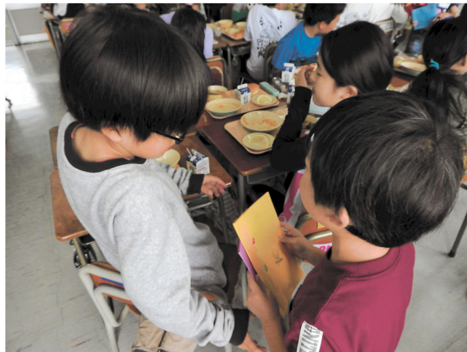
2年生から5年生へ「野外活動、気をつけて行ってらっしゃい！」

私たちは、この広い校庭で学年関係なく、仲良く遊んでいます。休み時間は異年齢交流で仲を深めるのに大切な時間です。休み時間の楽しい交流のおかげで、みんなが安心して楽しく生活しています。