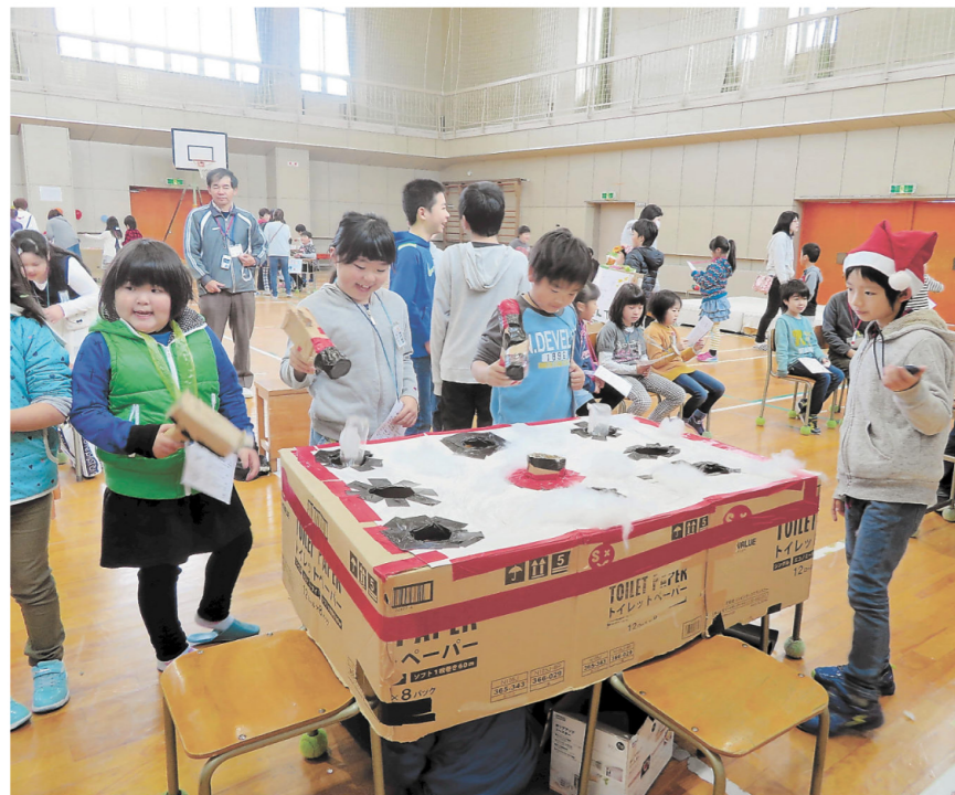
全校児童も地域の方も毎年楽しみにしている「なるせ祭り」

南郷小学校では、毎年「なるせ祭り」という児童会行事を行っています。おうちの人や地域の3、6年生がお店を出します。毎年人気がある