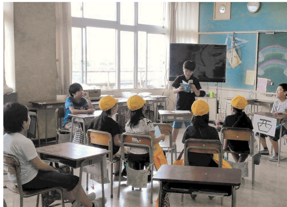
「かやの実まつり」ではクイズの店など5、6年生が工夫したたくさんのお店が出ます

私たちの学校は、遺跡の上にあります。たくさんの土器などが発掘され、栗遺跡と名付けられました。学校の校章は土器をかたどっています。児童会のマスコットは栗の形のカワイイキャラクターで、みんなに親しまれています。この栗遺跡は私たちの地域の誇りです。これからも大切な歴史を伝え、つなげていきたいと思っています。