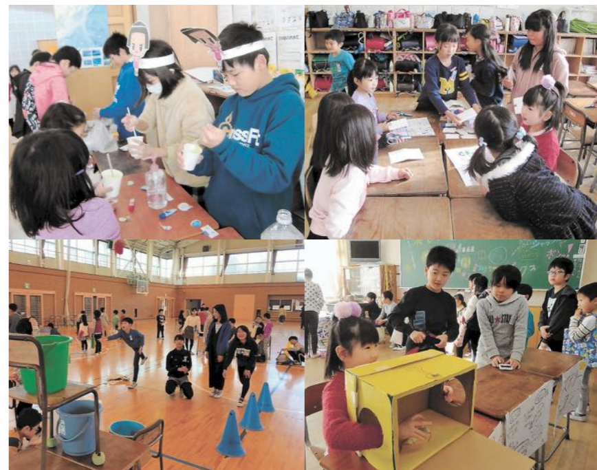
みんなで決めたスローガンのように、笑顔がいっぱいのお祭りになりました=2019年11月22日

多賀城小には、たてわり活動があります。1～6年生が班のみんなで遊んで、学年の枠をこえて絆を強めるためのものです。年に3回あり、1、2回目は6年生が、3回目は5年生が計画を立て、みんなで楽しめます。活動後は「もっと遊びたかった」という声が聞かれ、休み時間に自然に会話をする姿も見られるようになります。