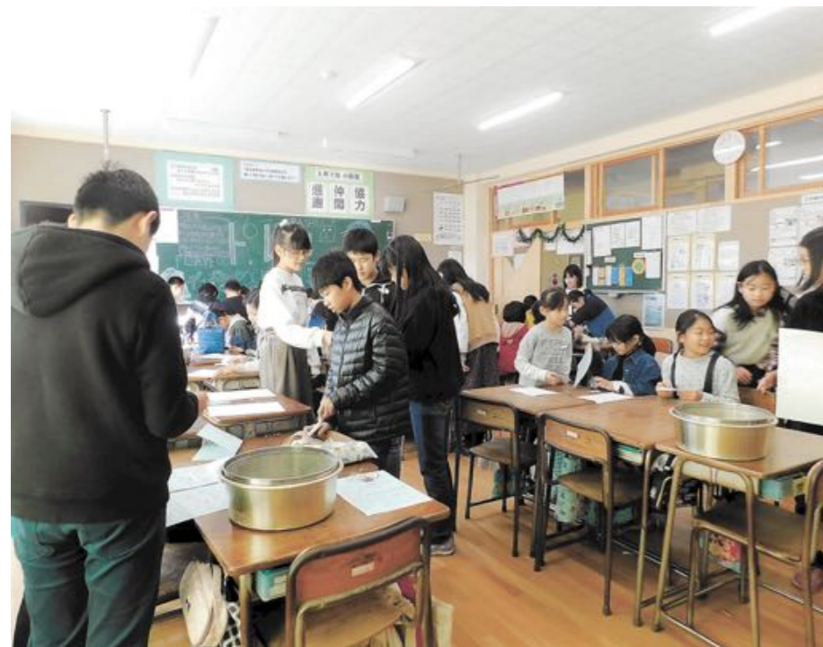
「みつばまつり」では、3～6年生が工夫した楽しいお店が出ます

三本木小学校では、毎年11月中旬に「みつばまつり」という児童会行事をお店を、全校の児童が3～6年生それぞれで、6年生がクラス単位で行っています。3～6年生が工夫した楽しいお店が出ます。今年のお店の前は、大行列で、中には泣きだす低学年の子もいます。6年生になったらおぼけやしきのお店ができる楽しみにしている低学年の子もたくさんいます。