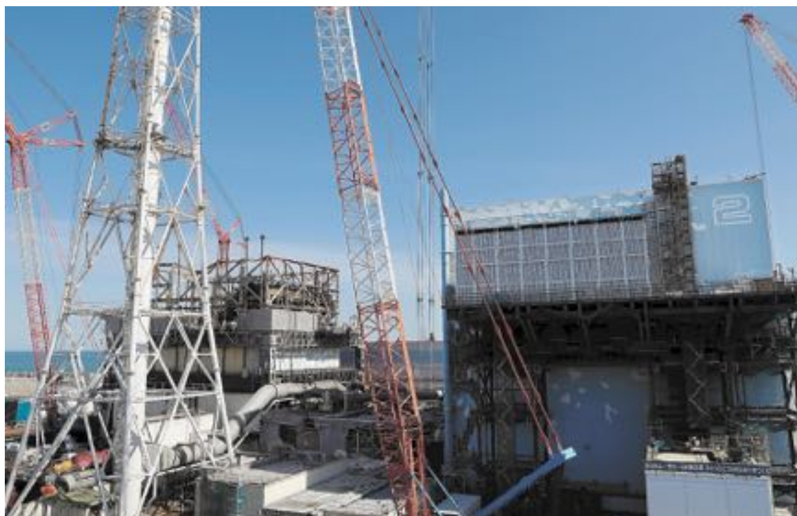
東京電力福島第1原発の1号機(左奥)と2号機の原子炉建屋=2月21日

◇ 原発事故は今も終わっていないくて、被災者は苦しんでいるんだね。そんな人たちへのいじめや差別は絶対なくしたいね。