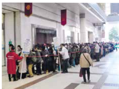
百貨店の開店を待つ人々の列。何時間も並んで、限られた食品などをようやく少し買うことができました。2011年3月19日 仙台市青葉区一番町