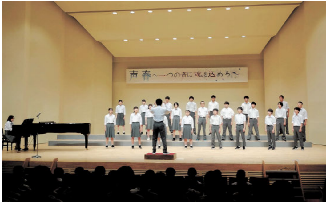
最優秀賞(さいゆうしゅうしょう)をとった3年4組の生徒たち

合唱祭3年ぶりに開催 大沢中学校では7月、「合唱祭」を行いました。新型コロナウイルスの影響で3年ぶりの開催となりました。これまで「沢中祭」「体育祭」と並ぶ三大行事の一つ「合唱コンクール」として取り組んできました。しかし、祭りのようにみんなで合唱を楽しみたいとの思いを込めて、本年度改名しました。 全学年で久しぶりに合唱で不安もありましたが、放課後に練習を重ね、少しずつ歌声がまとまっていきました。他学年とも歌声交換会を行いました。 活動が制限されるコロナ禍で、合唱祭を開催できたことは、私たちにとってとても良い経験になりました。今後もこの経験を生かして、活動していきたいです。