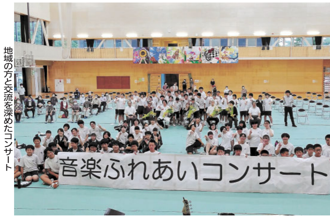
地域の方と交流を深めたコンサート

会場は和太鼓演奏や美しい歌声に包まれ、みんなで手拍子をしたり、手を振ったりと一体感が生まれました。地域の方々とお会いする機会が少なくなっている中で、音楽を通して、つながりを深めることができました。日常生活でも、お年寄りや体の不自由な人と互いに声をかけ合い、支え合う関係でありたいと心の底から思いました。不安が絶えない世の中ですが、地域で共に助け合い、笑顔あふれる町にしていきたいです。