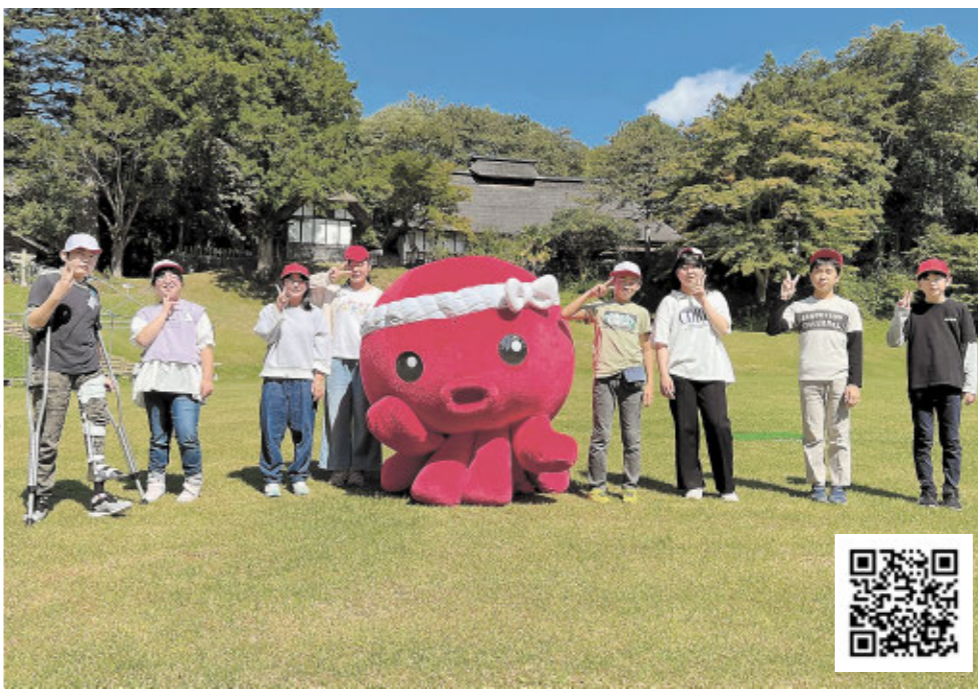
南三陸町のキャラクター「オクトパス君」と撮影した動画の一場面。QRコードにアクセスしてください

メディア「南三陸なう」の皆さんの協力をいただきながら、町に出て撮影を続けました。美しい風景や楽しいイベントの様子などたくさん集めました。動画はQRコードを読み込むと見られますので、ご覧ください。学習を通して、町の魅力を再発見することができました。私たちが伝えていくことで、これからまちづくりに貢献していきたいです。歴史、自然、文化の魅力に触れることができる、南三陸町や入谷地区に、ぜひ来てください。