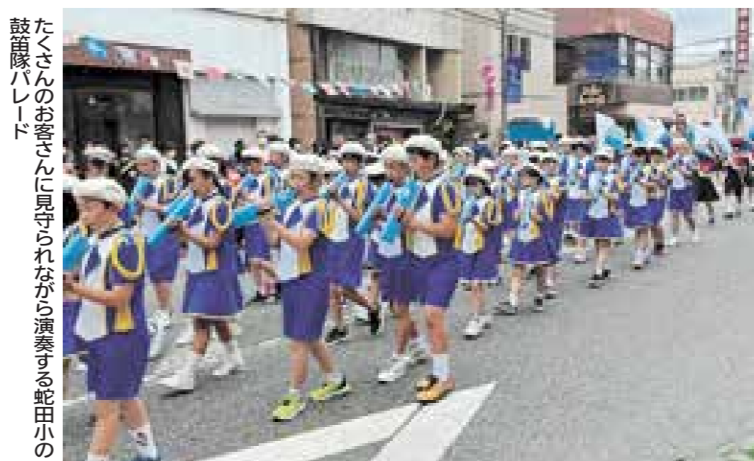
たくさんのお客さんに見守られながら演奏する蛇田小の鼓笛隊パレード

パレードを終えて、秋からは私たち6年生が5年生に伝えていく番です。総合的な学習の時間や休み時間を利用して、演奏の仕方や足踏みなどを教えています。分かりやすく教えるのは大変ですが、少しずつ上達していく姿を見るととてもうれしくなります。もうすぐ引き継ぎ式が行われます。蛇田小の伝統をしっかり未来につなげるために、最後まで頑張ります。