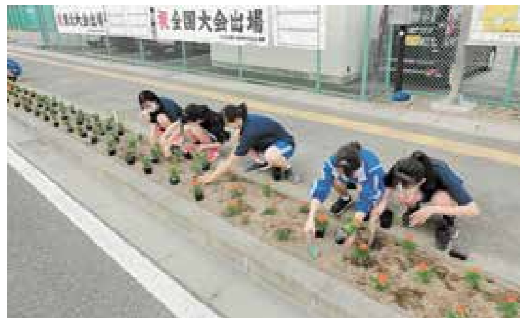
花壇に色とりどりの花を植える生徒たち

二つ目は「あいさつ運動」です。生徒会執行部を中心、六郷小学校の計画委員の皆さんと協力し、月に1、2回、活動します。あいさつを交わすことが恥ずかしいと感じている人が、参加しやすい雰囲気になるように心がけています。運動の輪は広がり、仙台東高校の生徒の皆さんと一緒に取り組めるようになりました。新型コロナ禍で地域の皆さんとの交流は限られますが、これからも地域に貢献できるようにしていきたいです。