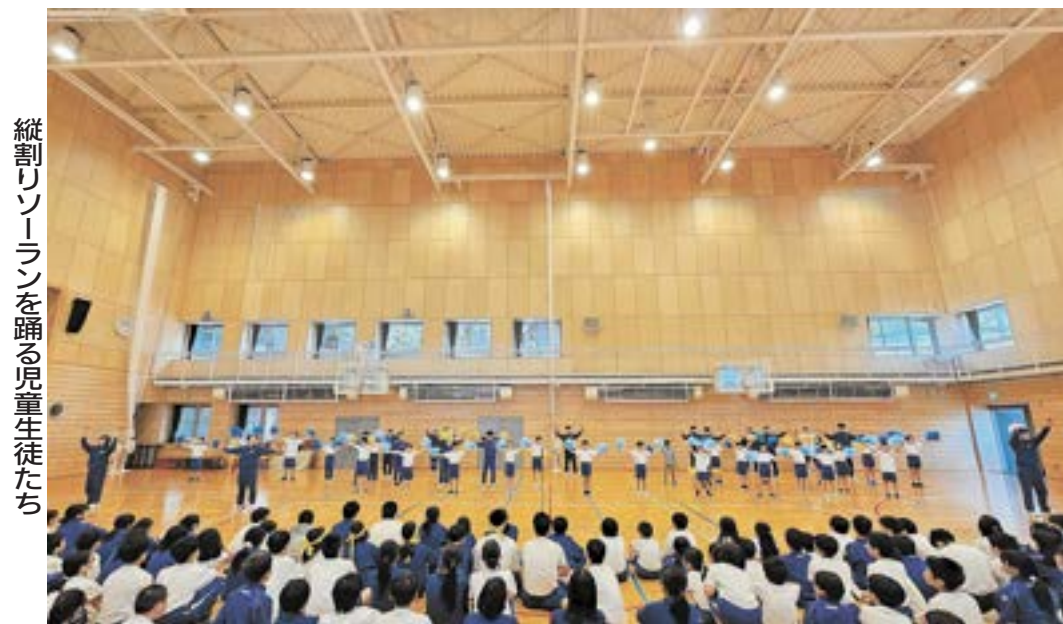
縦割りソーランを踊る児童生徒たち

毎年10月に行われる金成小中祭で披露されます。発表に向けての練習では、9年生が中心となり、前期課程への踊りの指導や班の統率を行います。班の児童生徒をまとめ、熱心に指導を行う