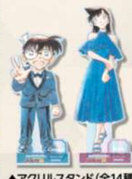
▲アクリルスタンド(全14種)