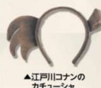
▲江戸川コナンのカチューシャ