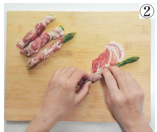
②豚肉に塩、コショウをしてアスパラを巻き、油でこんがり焼く。