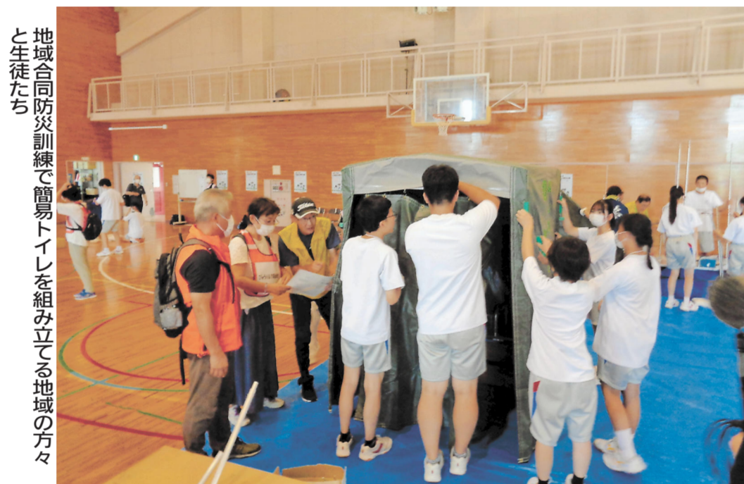
地域合同防災訓練で簡易トイレを組み立てる地域の方々 と生徒たち

柳生中学校では地域の方々に協力いただき、さまざまな活動を行っています。そのうちのいくつかを紹介しましょう。 地域合同防災訓練は、地域と小中学生が一体となって実施しました。中学生は地域の方々からの指示を受け、簡易トイレの設置や消火活動の補助をし、防災や災害について考えるきっかけになっています。 健全育成の活動も活発です。毎年「住みよい地域を目指す標語」を学区の小中学校や保護者にも募り、選ばれた標語を表紙