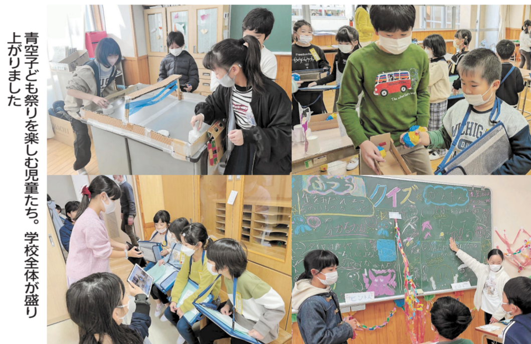
青空子ども祭りを楽しむ児童たち。学校全体が盛り上がりました

増田西小学校では、12月に青空子ども祭りを行っています。3年生以上のクラスそれぞれが楽しく遊べるお店を出し、全校児童がお客さんになって楽しむお祭りです。 昨年は感染症が流行してしまい、兄弟学年での交流になってしまいました。お客さんに喜んでもらえるように工夫してお店を作りました。ペットボトルやトレットペ