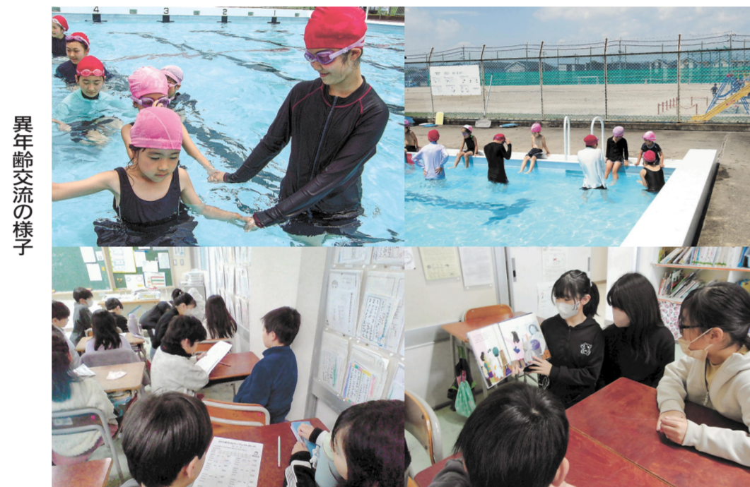
異年齢交流の様子

6色に分け縦割り活動 沖野東小学校は、赤、桃色、黄色、緑色、青色、紫色の6色のグループに分かれて縦割り活動を行っています。6年生が中心となって全員が楽しめるような遊びを考えています。 異年齢での交流活動も大切にしています。私たち6年生は、1年生の朝の準備や給食の下膳の手伝い、一緒にプールにも入りました。手伝わったときに、1年生から「手伝ってくれてありがとう」と言われてすごうれしかったです。ある日、下膳を手伝おうと1年生