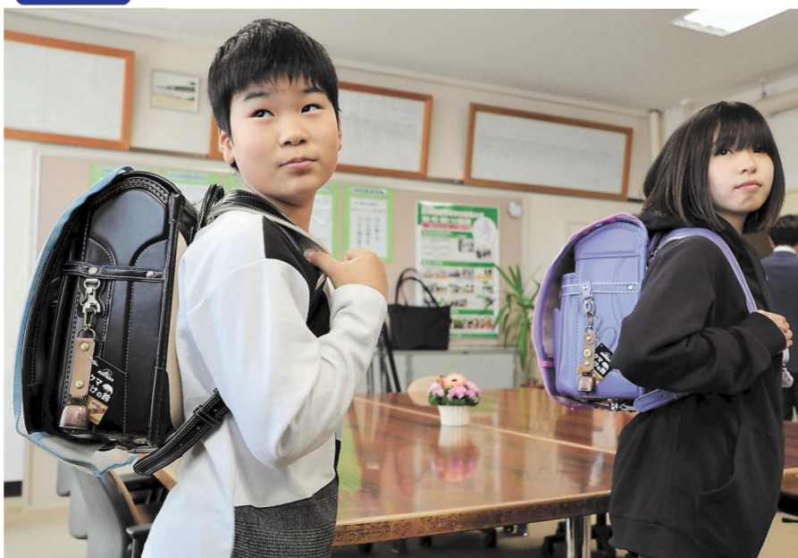
クマ鈴を付けたランドセルを背負う児童たち